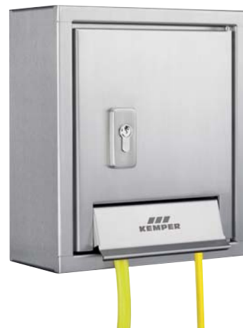
KEMPER 'Mini-Tresor' wandopbouwkast Figuur 212, H/B/D: 315x280x132 mm