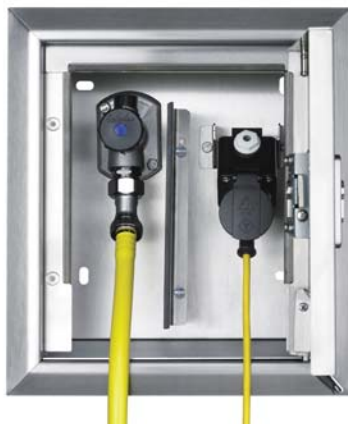
KEMPER 'Mini-Tresor' wandinbouwkast Figuur 211, H/B/D: 340x300x120 mm, de compacte verzorgingsstation voor ééngezinwoningen

Technisch volmaakt en elegant van vormgeving: KEMPER 'Tresor' de compacte aansluitkast buiten, maakt het mogelijk gelijktijdig aan te sluiten op water en elektriciteit op één plaats. Het maakt niet uit voor welke toepassing of welk apparaat, u vindt altijd de juiste grootte en uitvoering.