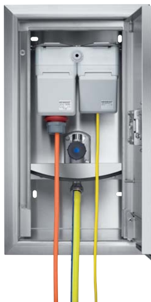
KEMPER 'Tresor' wandinbouwkast Figuur 210, H/B/D: 470x250x120 mm

Het verzorgingsstation met verschillende aansluit mogelijkheden, b.v. water- en stroomaansluiting voor 230V / 400 V, bouwzijdig uit te bereiden b.v. voor gas-, telefoon-, antenne of afvoer aansluitingen, voor privé en zakelijk gebruik.