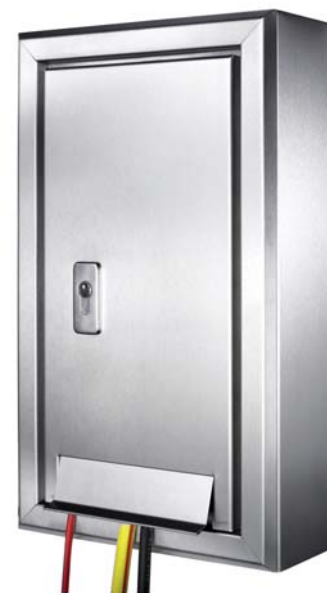
KEMPER 'Tresor' wandopbouwkast Figuur 213, H/B/D: 510x285x130 mm, voor het naderhand snel en schoon installeren op een reeds afgewerkte buiten- muur en voor wanden welke niet sterk genoeg zijn voor inbouw